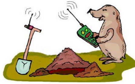
Bugünlerde her şey uzaktan kumandalı oldu

Röle kontağına bağlı klemens grubuna kumanda etmek istenilen cihazın besleme uçları bağlanmalıdır. Kontaklar normalde açık konumdadırlar. Röleler aktif iken kontaklar kısa devre durumuna geçerler (anahtar açık anlamında)