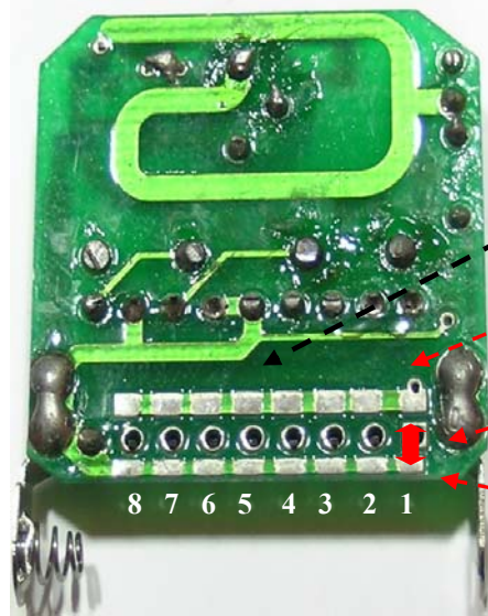
Verici (elcik) cihazında şifre bölümü

Not: Bulduğunuz çevrede dışarıdan herhangi bir kod uyuşması halinde cihazınız açılabilir. Böyle durumlarda kod verme işleminin yapılması gerekir.